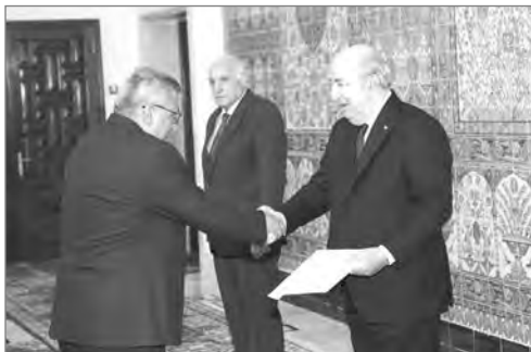
L'AMBASSADEUR D'ARMÉNIE, HRACHYA POLADYAN

Forte volonté de développer les relations avec l'Algérie