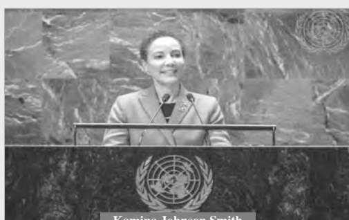
Kamina Johnson Smith

Selon la même source, l'armée d'occupation sioniste a commis 6 massacres au cours des dernières 24 heures dans la bande de Gaza, faisant 79 martyrs et 86 blessés. Les autorités palestiniennes de la Santé ont également indiqué qu'un certain nombre de victimes palestiniennes se trouvent encore sous les décombres et sur les routes, et que les forces de l'occupation empêchent les ambulances et les équipes de la Protection civile de leur porter secours. Depuis le 7 octobre 2023, l'armée sioniste mène une agression sauvage contre l'enclave palestinienne qui a entraîné des destructions massives d'infrastructures en plus d'une catastrophe humanitaire sans précédent.